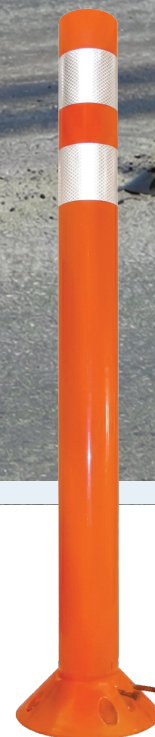
DP 200 con Base Giratoria

Los postes canalizadores salvan vidas al dirigir adecuadamente el tráfico, reduciendo la eventualidad de accidentes en múltiples ubicaciones. Nuestros postes son altamente visibles de día y de noche . Delinean claramente la división de carriles con colores brillantes y bandas reflectivas. Para reducir el riesgo de accidentes, coloque estos durables postes canalizadores de poliuretano en los puntos críticos a lo largo del camino, donde exista peligro en la seguridad.